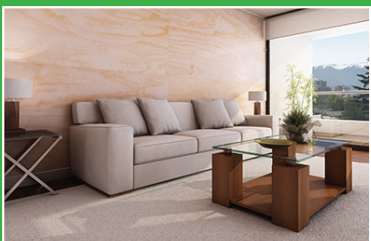
Revestimientos interior y exterior, muros, cielo.