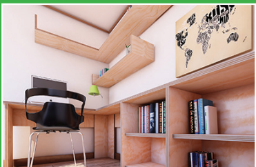
Hágalo usted mismo, embalajes, mueblería y base para laminación.